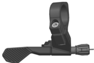
CONTACT SWITCH CORE