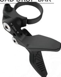
GIANT ROAD DROP-BAR REMOTE