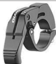
GIANT VERTICAL REMOTE